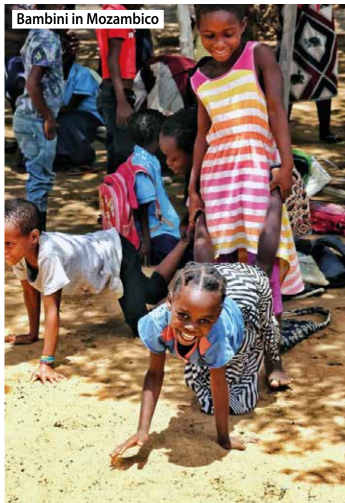
Bambini in Mozambico