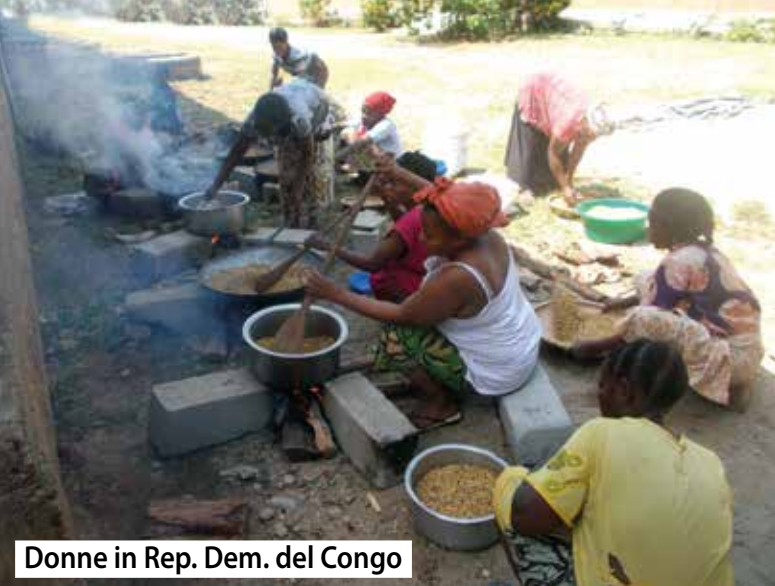
Donne in Rep. Dem. del Congo