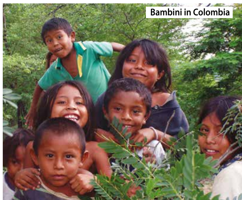
Bambini in Colombia