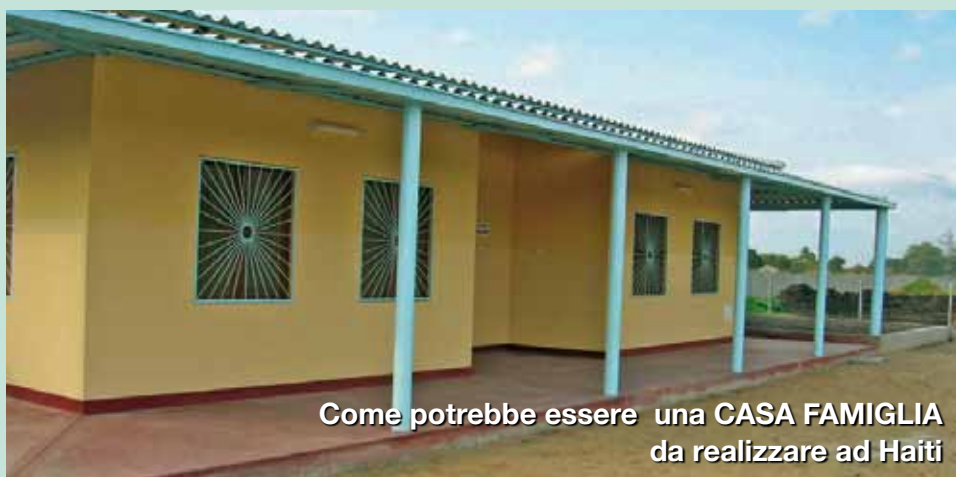
Come potrebbe essere una CASA FAMIGLIA da realizzare ad Haiti