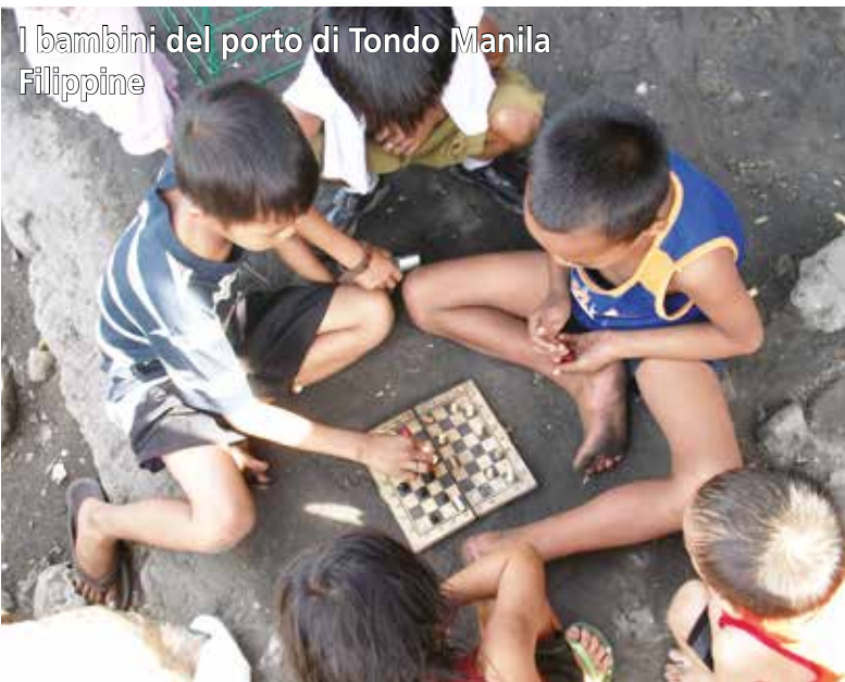
1 bambini del porto di Tondo Manila Filippine