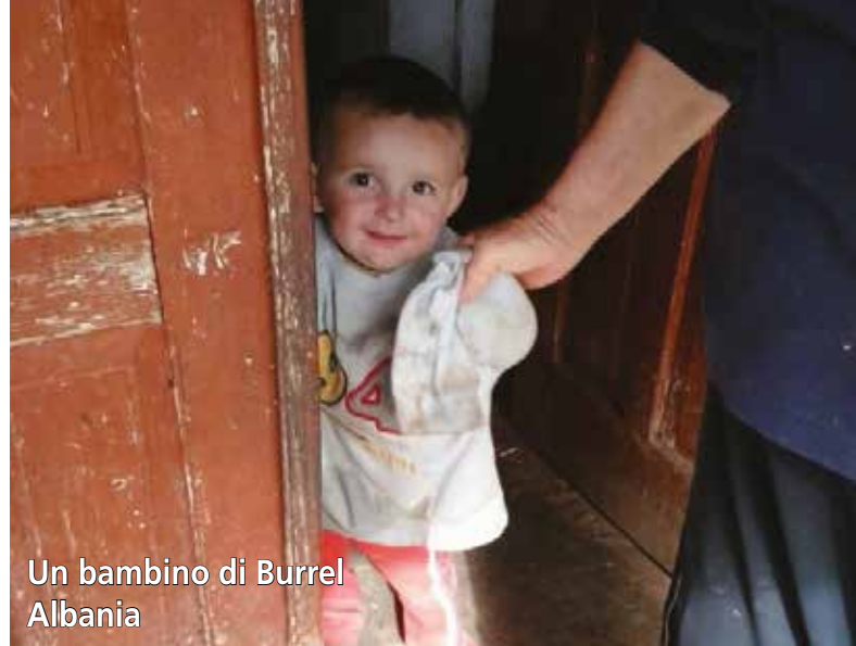
Un bambino di Burrel Albania