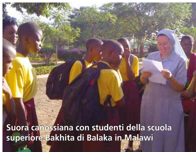
Suora canossiana con studenti della scuola superiore Bakhita di Balaka in Malawi