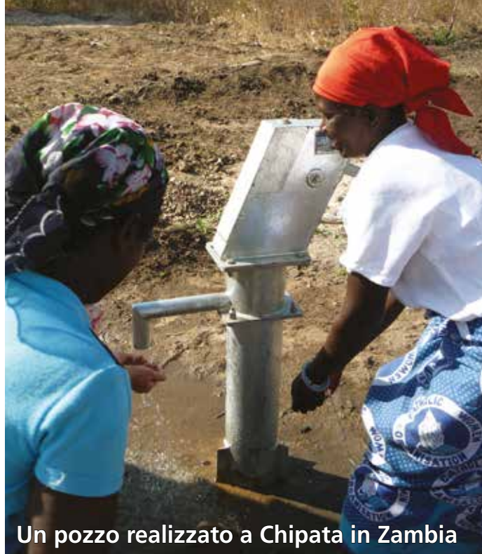
Un pozzo realizzato a Chipata in Zambia